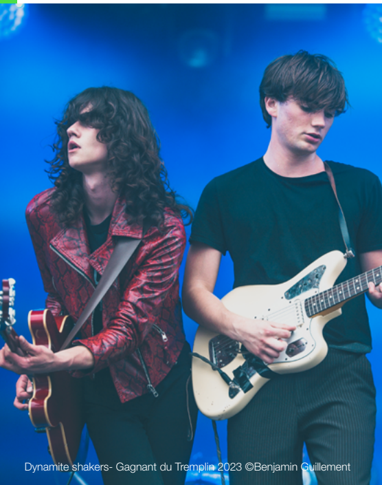
Dynamite shakers- Gagnant du Tremplin 2023

La formation gagnante décrochera son ticket d'entrée pour se produire sur la scène du festival lors de l'édition de 2025. L'an dernier, c'est le quatuor vendéen Désert Désir qui a tiré son épingle du jeu, les amenant à figurer sur l'affiche de la 24e édition, avec un concert programmé le samedi 6 juillet 2024.